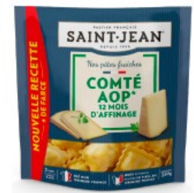
RAVIOLI Comté AOP 12 mois d'affinage