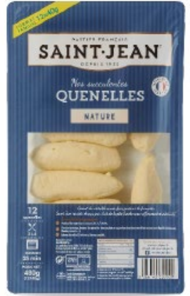
QUENELLES 12X40G NATURE