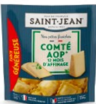
RAVIOLI COMTÉ AOP 12 MOIS D'AFFINAGE – 250G