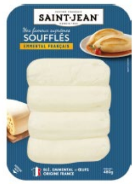
SUPRÊMES SOUFFLÉS 4*120G EMMENTAL FRANÇAIS