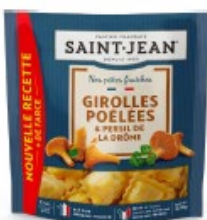
RAVIOLI 250g GIROLLES POÊLÉES PERSIL DE LA DRÔME