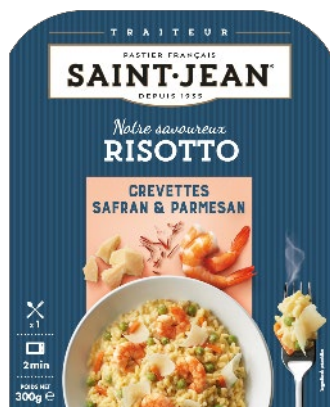
RISOTTO CREVETTE SAFRAN ET PARMESAN