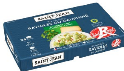
RAVIOLES DU DAUPHINÉ ULTRA FRAÎCHES PRÉSENTOIR 24 PLAQUES