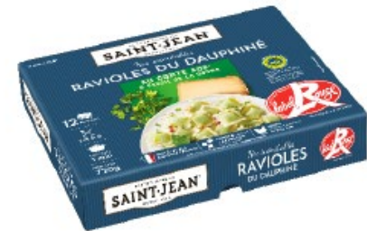
RAVIOLES DU DAUPHINE PRÉSENTOIR 12 PLAQUES