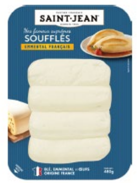
SUPRÊMES SOUFFLÉS EMMENTAL FRANÇAIS