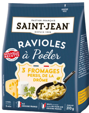
RAVIOLES A POÊLER 310g 3 FROMAGES PERSIL DE LA DRÔME