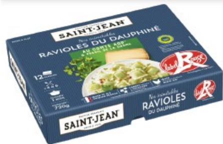
RAVIOLES DU DAUPHINÉ ULTRA FRAÎCHES PRÉSENTOIR 12 PLAQUES