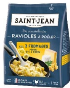
RAVIOLES A POÊLER 310g 3 FROMAGES PERSIL DE LA DRÔME