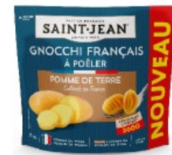
GNOCCHI FRANCAIS 300g 67% DE POMME DE TERRE