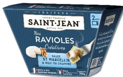
BOX DE RAVIOLES SAUCE ST MARCELLIN