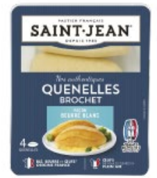
QUENELLE BEURRE 4*85G BROCHET BEURRE BLANC