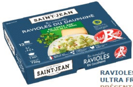
RAVIOLLES DU DAUPHINÉ ULTRA FRAÎCHES PRÉSENTOIR 12 PLAQUES