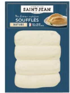
SUPRÊME SOUFFLE 4*120g NATURE