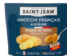
GNOCCHI FRANÇAIS 300g 67% DE POMME DE TERRE