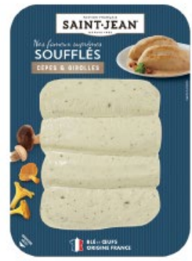
SUPRÊMES SOUFFLÉS 4*120G CEPES GIROLLES