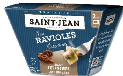
BOX DE RAVIOLES SAUCE FORESTIERE AUX MORILLES