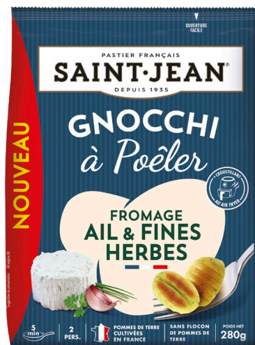
GNOCCHI A POÊLER 280g AIL & FINES HERBES