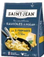
RAVIOLES A POÊLER 310g 3 FROMAGES PERSIL DE LA DRÔME