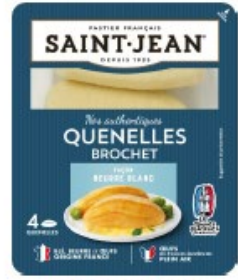
QUENELLES BROCHET BEURRE BLANC 4*85g