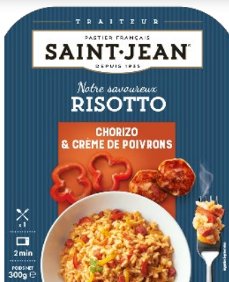
RISOTTO CHORIZO CREME DE POIVRONS