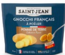
GNOCCHI FRANÇAIS 300g 67% DE POMME DE TERRE