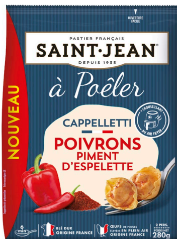
CAPPELLETTI A POELER – 280g POIVRONS PIMENT D'ESPELETTE