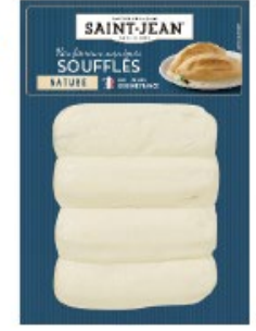
SUPRÊMES SOUFFLÉS NATURE