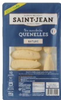
QUENELLES 12X40g NATURE