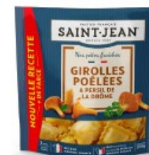
RAVIOLI 250g GIROLLES POÊLÉES PERSIL DE LA DRÔME