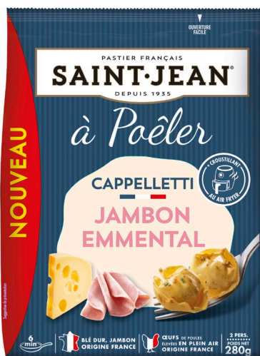
CAPPELLETTI A POELER – 280g JAMBON EMMENTAL