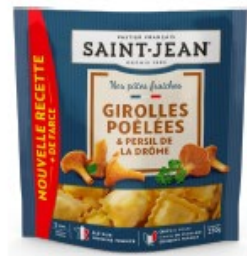
RAVIOLI 250g GIROLLES POÊLÉES PERSIL DE LA DRÔME