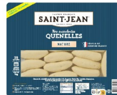
QUENELLES 25*40g NATURE