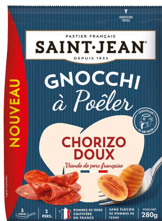
GNOCCHI A POÊLER 280g CHORIZO DOUX