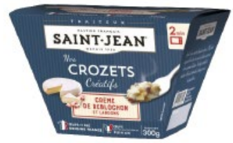
BOX DE CROZETS CREME DE REBLOCHON & LARDONS - 300g