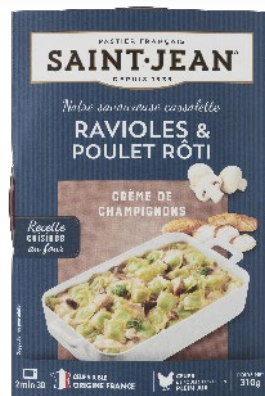
CASSOLETTE RAVIOLES & POULET RÔTI CRÈME CHAMPIGNONS