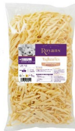
TAGLIATELLES 1KG - ROYANS